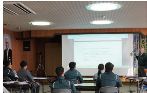
社内教育実施風景