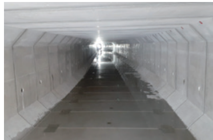
第68期 年次報告書「工事紹介」に掲載しました