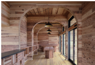
当社、信楽本店店内オフィス

CLTとは多くの木材を使用した木質パネル(直行集成板)です。パネルを作成する際には、間伐や成熟した木の伐採を行います。若くて元気な木が育つ環境を整えることは、森林の回復を促す効果があるため、最終的にCLTはバイオマス発電の燃料となって、持続可能な生産と消費を実現できます。