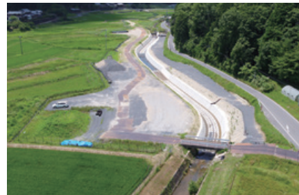
第69期 中間報告書「工事紹介」に掲載しました